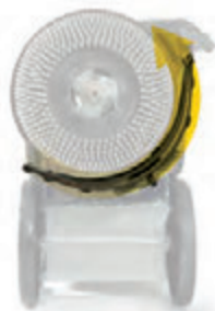
Rotation inversée du suceur parabolique