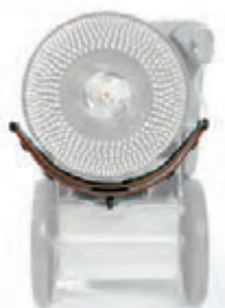
Position du suceur à l'arrêt