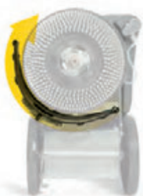
Rotation du suceur parabolique

La compacité du groupe d'aspiration (moteur et suceur) assure un assèchement optimal.